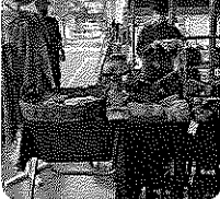
山科こころのつながる市 無印良品山科店